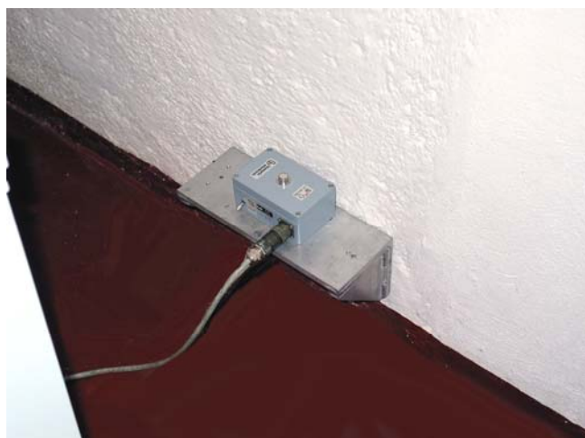
Ankoppelung der Messaufnehmer z.B. innen an der Kellerwand

Die Auswahl der Messorte richtet sich nach dem Zweck der Messungen und wird in der Regel zur Beurteilung der Einwirkungen auf das Gebäude, am Gebäude im Fundamentbereich und/oder an tragenden Bauwerksteilen in Obergeschossen, zur Beurteilung der Einwirkungen auf den Menschen in Gebäuden auf Geschossdecken, vorgenommen.