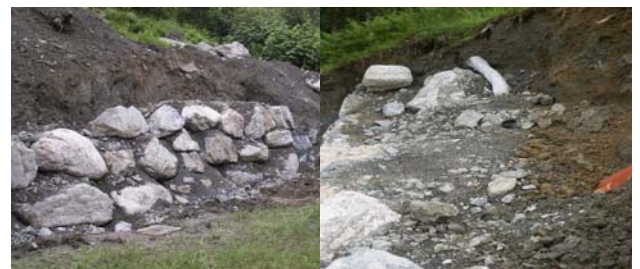
Bild 6: Steinsatz mit nicht kraftschlüssig versetzten Steinen (links) und für Drainagierung ungeeignetem Hinterfüllmaterial (rechts).

Die scheinbar einfache Konstruktion verleitet häufig zu einer nicht sachgemäßen Ausführung: Eine nicht frostsicher ausgeführte Gründung, durchgehende Lagefugen, ein nicht kraftschlüssiger Verbund der Einzelsteine oder ungeeignete oder völlig fehlende Drainagierungsmaßnahmen zählen hierbei zu den häufigsten Baufehlern (s.a. Bild 6).